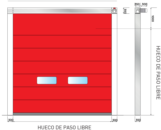
NF APILABLE MOTOR FRONTAL